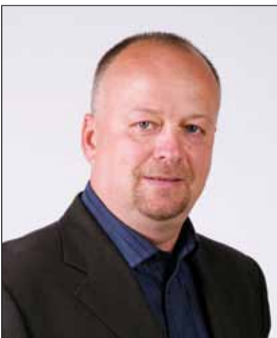
Pane Poláku, jak hodnotíte činnost místních akčních skupin v Jihomoravském kraji?

Jsem moc ráda, že je na dobré cestě nově rozpočtové určení daní, které by mělo ekonomicky pomoci menším obcím a venkovu obecně. Domnívám se, že nejlepšími hospodáři jsou vždy místní, kteří znají problémy, řeší je, žijí tu a zodpovídají se přímo občanům v daném regionu. O půdě, krajině a lesu to platí také, realizovala se celá řada krásných projektů, ale obecně s řešením otázky třeba zemědělství v rámci Evropské unie nemožou souhlasit. Myslím, že se mělo citlivěji navázat na naše možnosti krajiny, na tradice, zkušenosti aj. třeba už proto, abychom jedli místní produkty bez „čček“ a spousty najetých kilometrů.