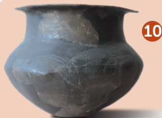
Nádoba mohylové kultury doby bronzové, 15. stol. př. n. l.