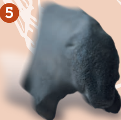
Plastika medvěda ze starší doby železné, sídlíště pod Malým chlumem.

Sídlíště neandrtálců (40 000 př. n. l.), opevněná sídlíště konce doby kamenné (3. tis. př. n. l.), sídlíště kultury se zvoncovitými poháry (2 000 př. n. l.), opevněné hradisko a řemeslná osada doby bronzové a železné (8. – 5. př. n. l.), germánské sídlíště (4. – 5. století), zaniklá vesnice (13. – 15. století).