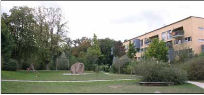
Příklad regulace: maximální výška domů byla stanovena tak, aby se i maminky z posledního patra dovolali na děti hrající si na veřejném prostranství.