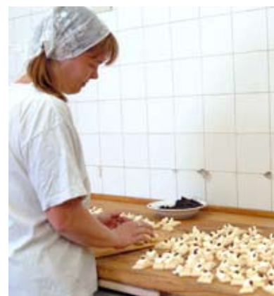
Pečlivě ženské ruce balí stovky svatebních koláčků.

Sloupská pekárna je ale také vyhlášená svým sladkým pečivem. Vánočky s mandlovými lupínky, které dlouho vydrží jako čerstvé, jdou na dračku. Konkurojí jim snad jen koláče. Větší pro